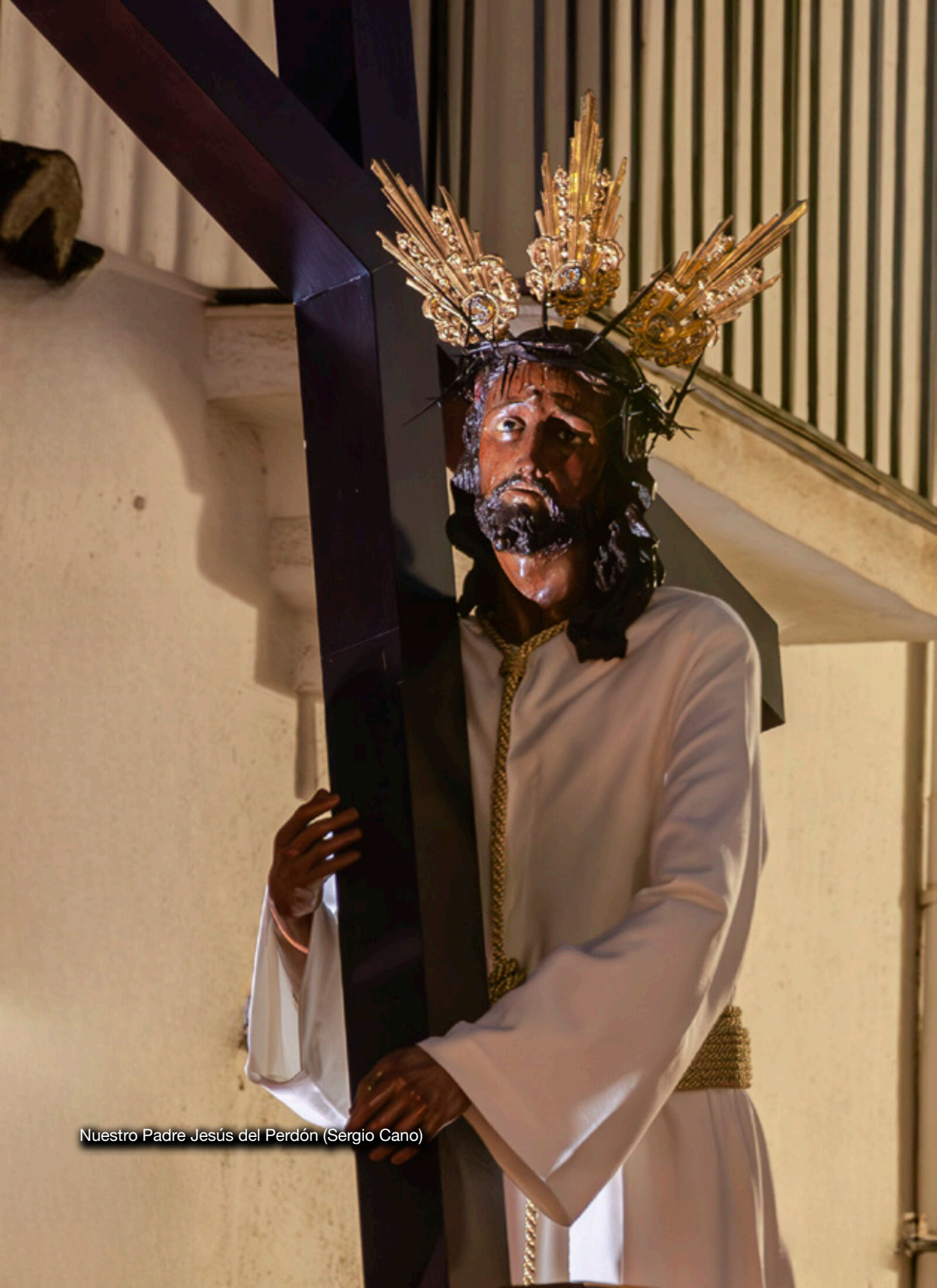
Nuestro Padre Jesús del Perdón (Sergio Cano)