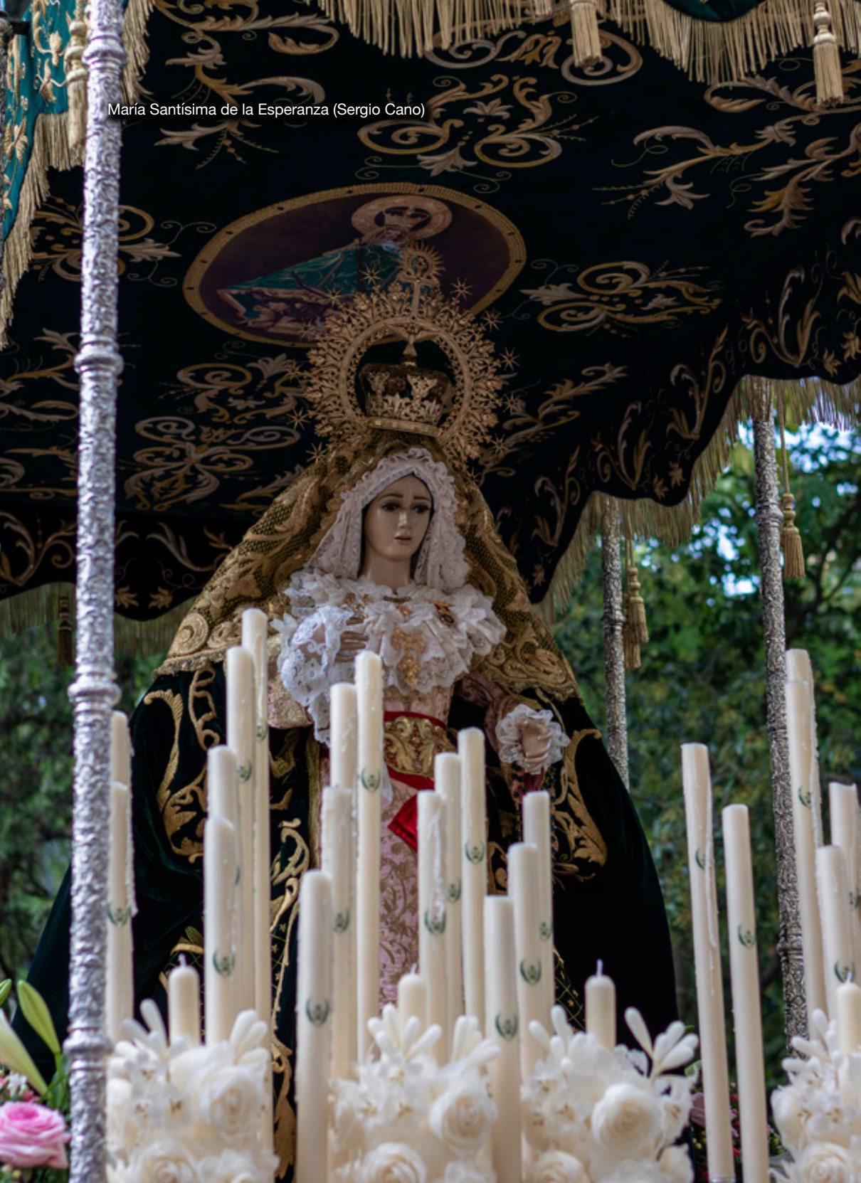
María Santísima de la Esperanza (Sergio Cano)