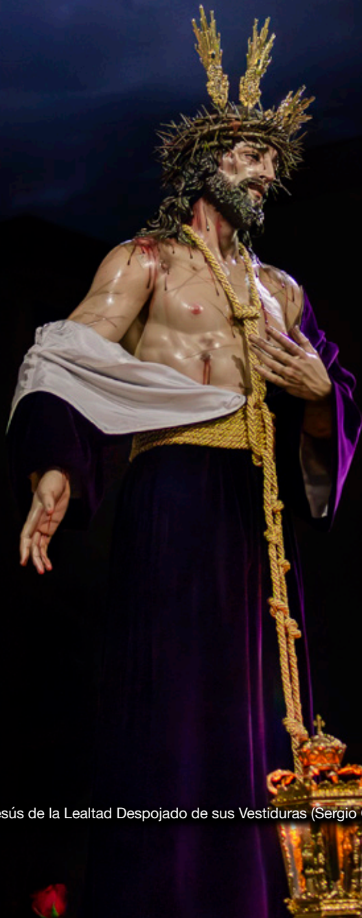
Ntro. Padre Jesús de la Lealtad Despojado de sus Vestiduras (Sergio Cano)