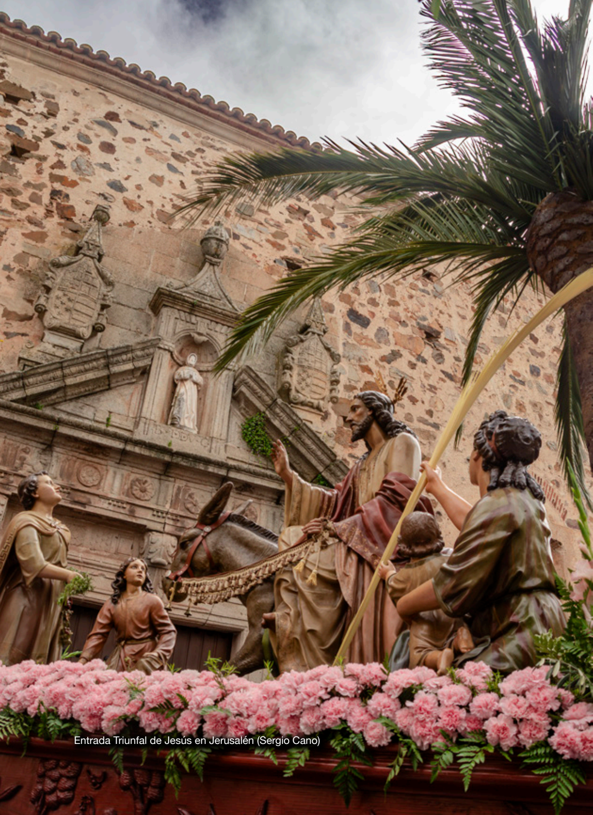
Entrada Triunfal de Jesús en Jerusalén (Sergio Cano)