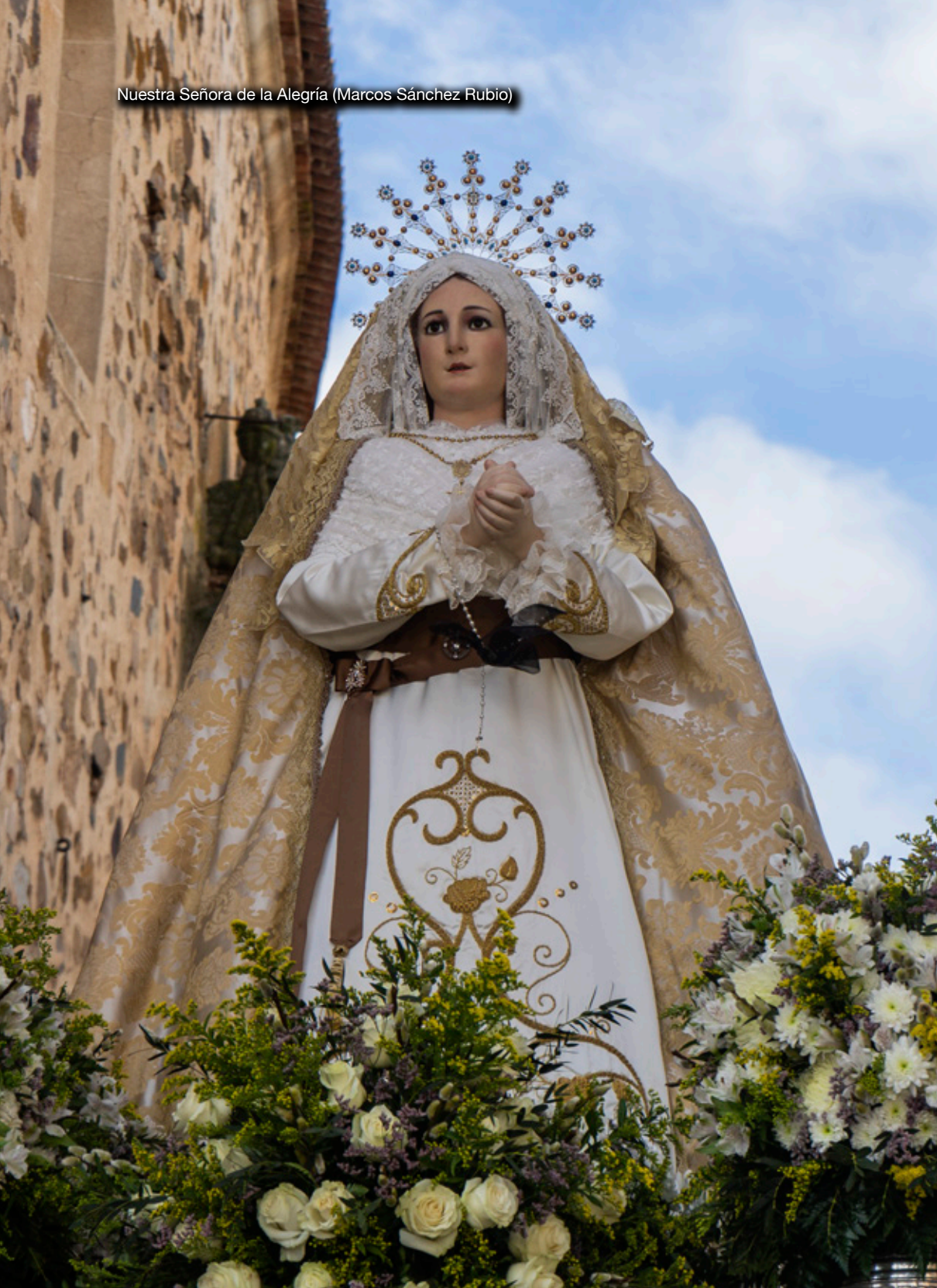
Nuestra Señora de la Alegría (Marcos Sánchez Rubio)