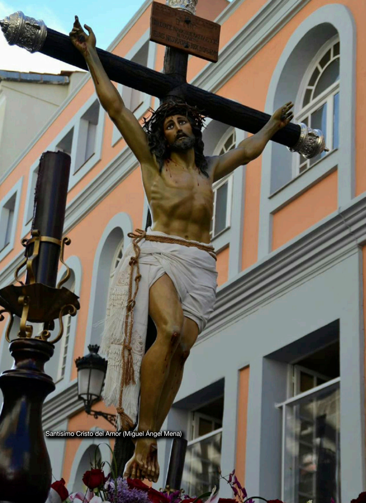
Santísimo Cristo del Amor (Miguel Ángel Mena)