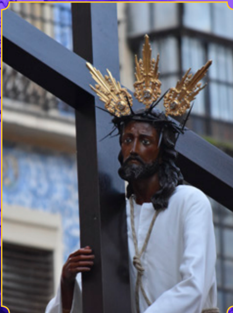
NUESTRO PADRE JESÚS DEL PERDÓN (Cofradía de los Ramos)