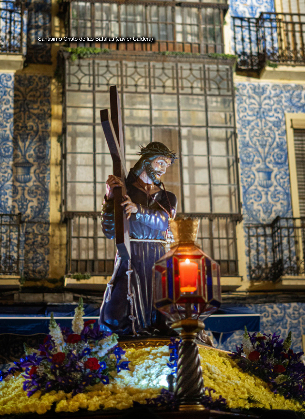
Santísimo Cristo de las Batallas (Javier Caldera)