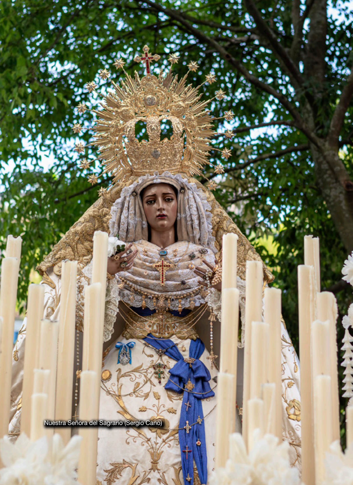
Nuestra Señora del Sagrario (Sergio Cano)