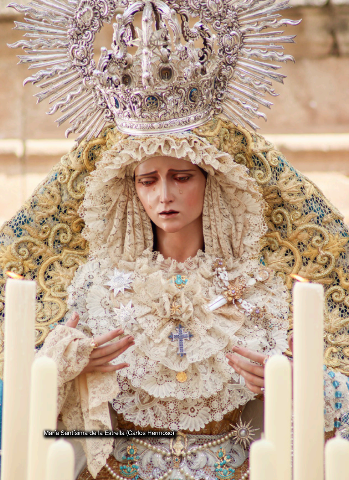
María Santísima de la Estrella (Carlos Hermoso)