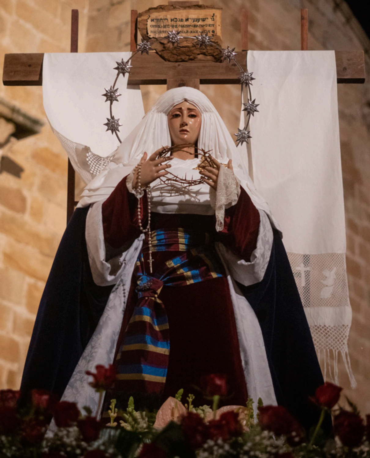
Nuestra Señora del Buen Fin y Nazaret (Javier Caldera)