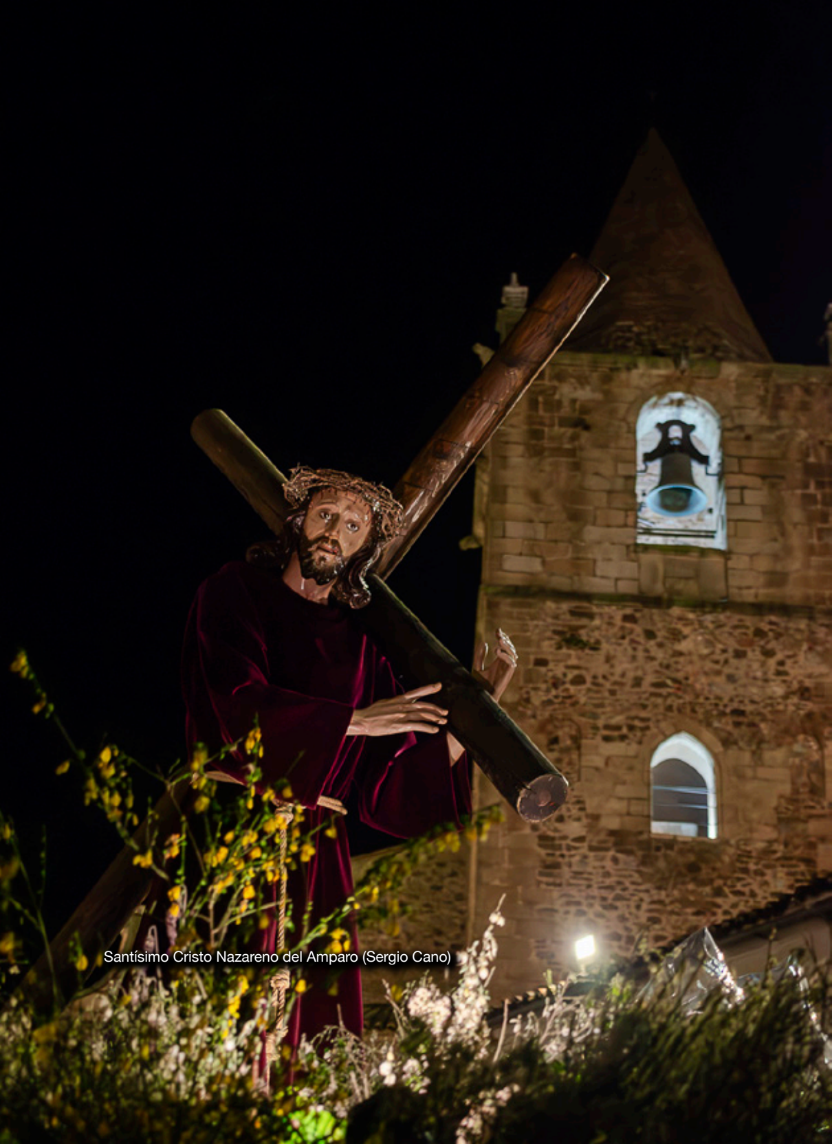
Santísimo Cristo Nazareno del Amparo (Sergio Cano)