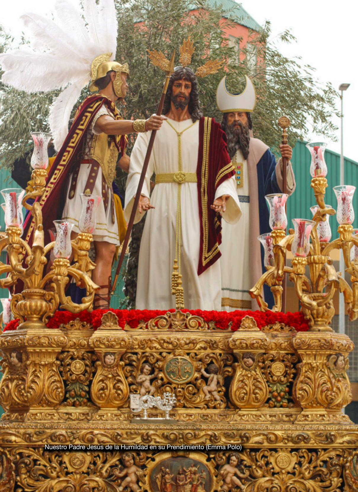
Nuestro Padre Jesús de la Humildad en su Prendimiento (Emma Polo)