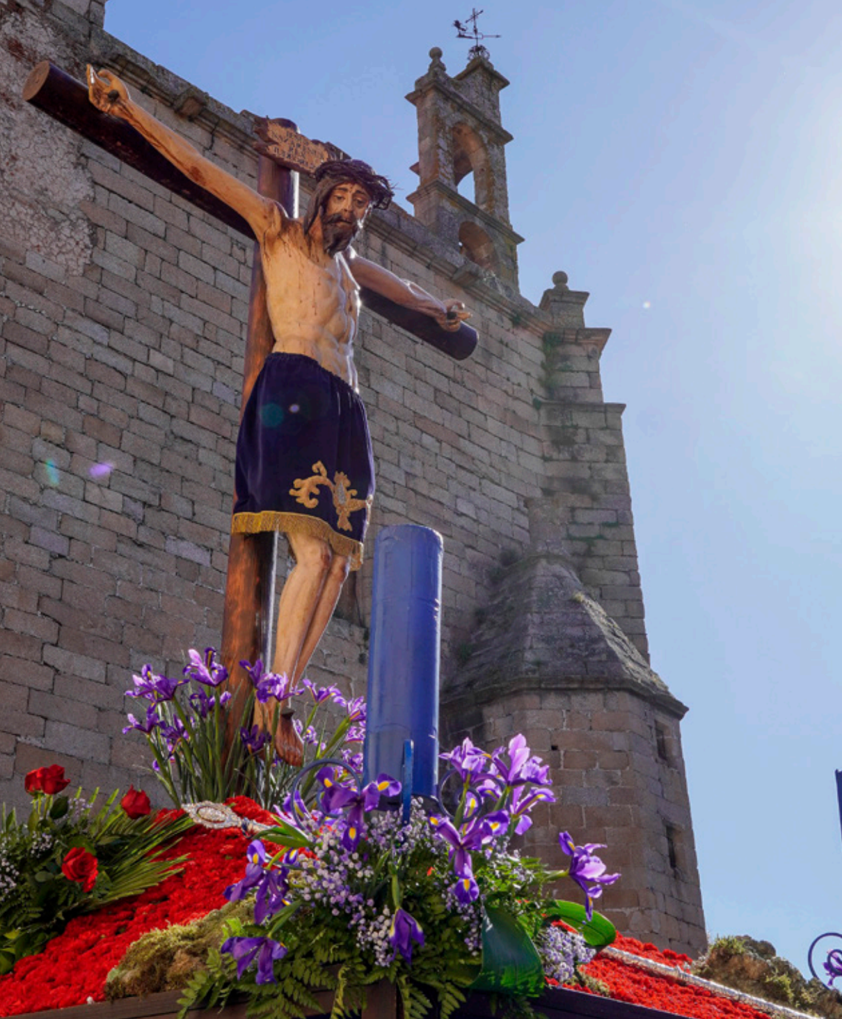
Nuestro Padre Jesús de la Expiración de la Arguijuela (Diego Ávila)