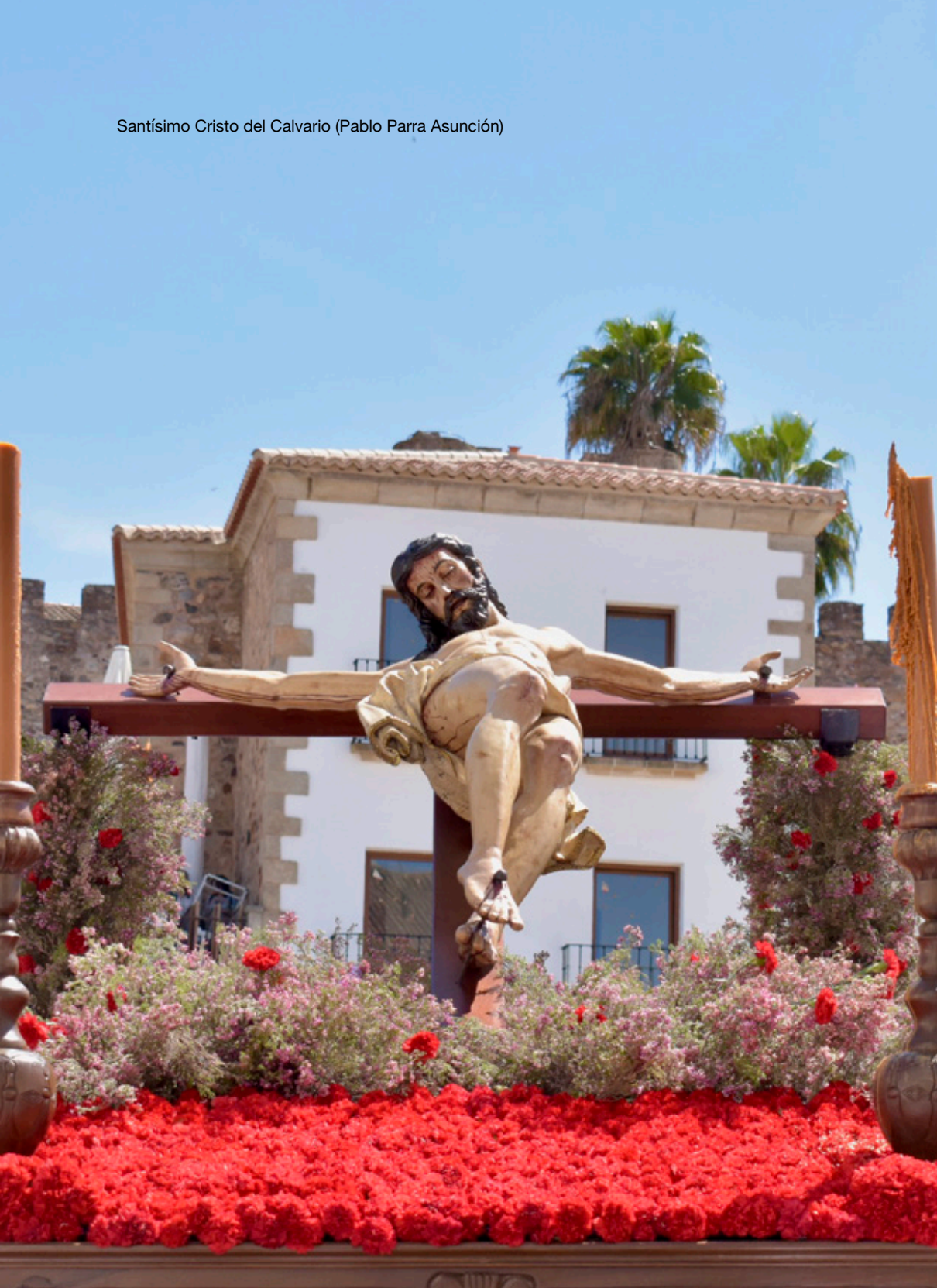
Santísimo Cristo del Calvario (Pablo Parra Asunción)