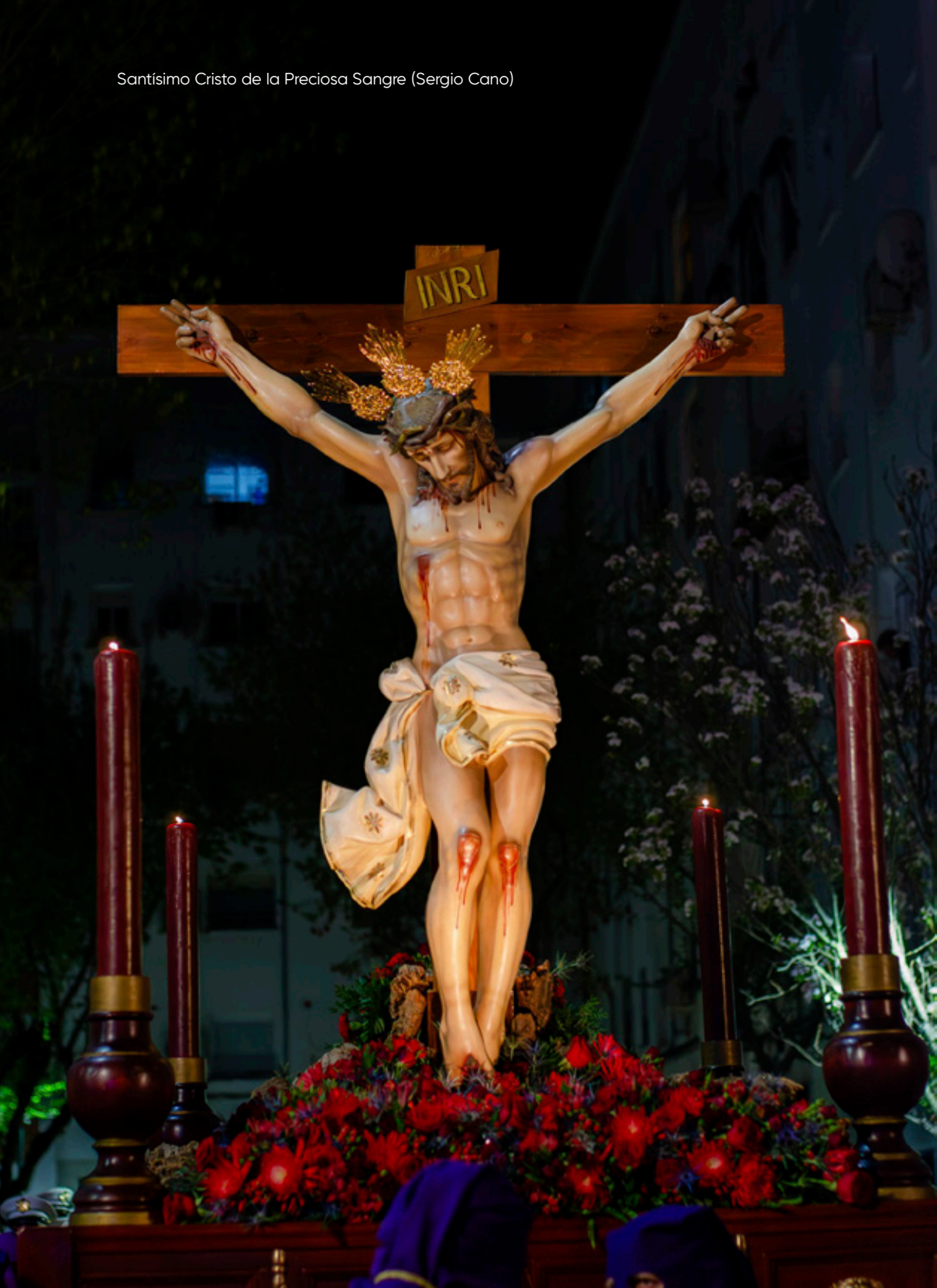
Santísimo Cristo de la Preciosa Sangre (Sergio Cano)