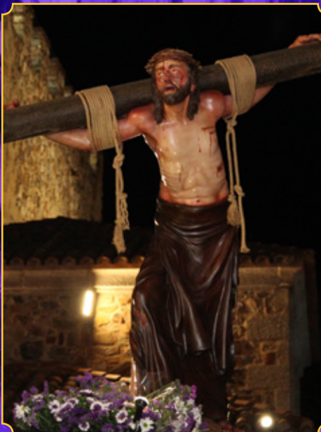
JESÚS CONDENADO (Cofradía de Jesús Condenado)