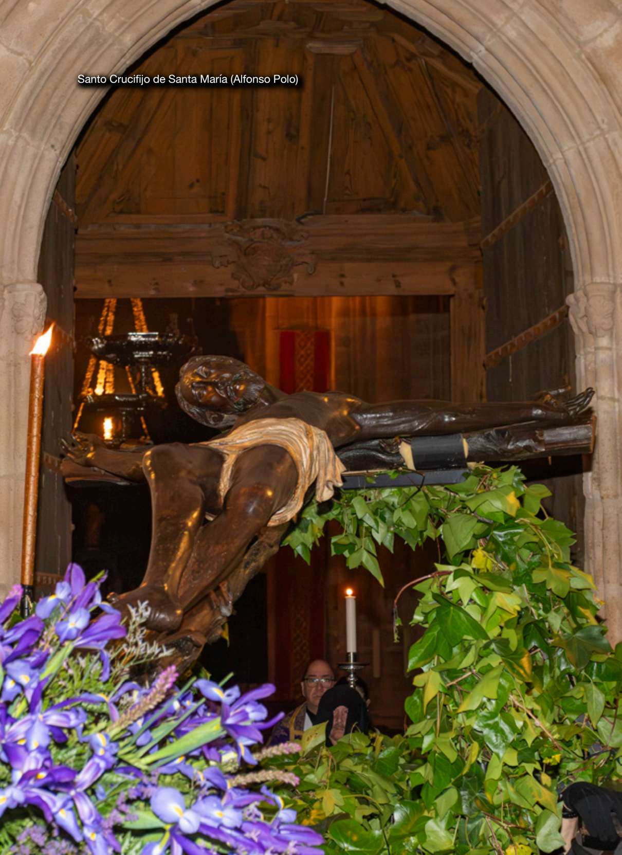
Santo Crucifijo de Santa María (Alfonso Polo)